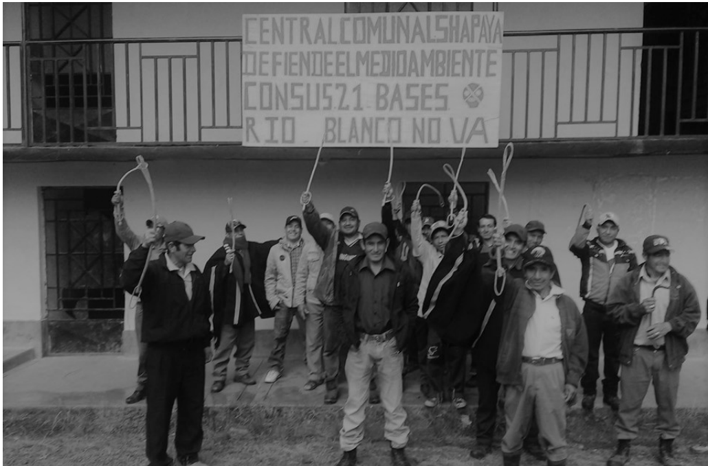
Ronderos de Ayabaca en el día de la Consulta vecinal del 16 de setiembre del 2007

lo que debe considerar la actualización de la base de datos de PPII a cargo del MINCUL.