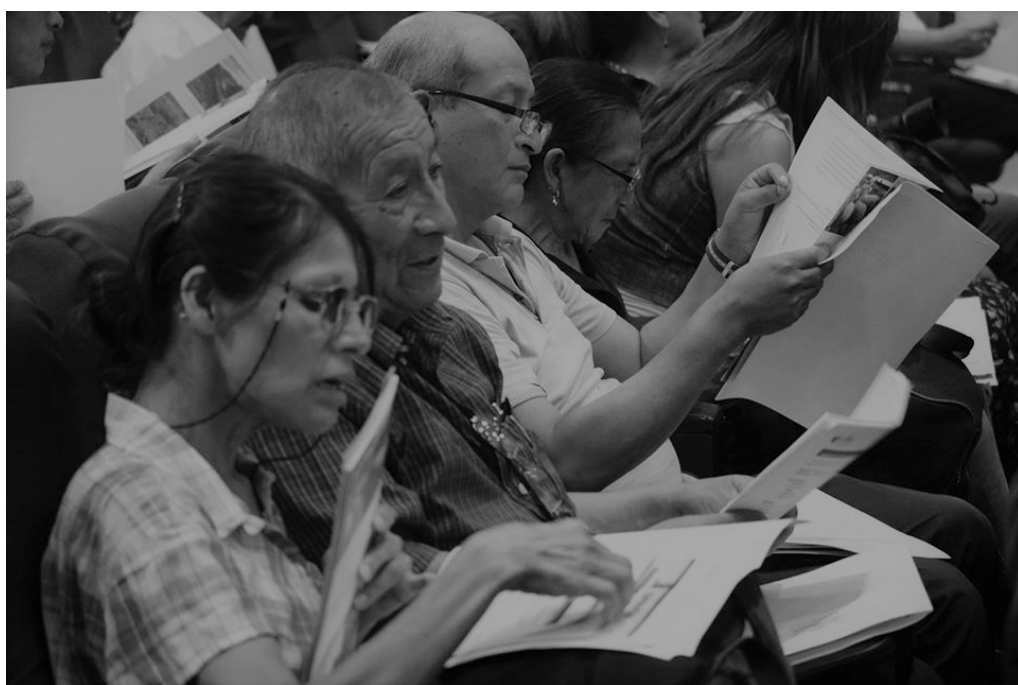
Público en evento organizado por Red Muqui y Comisión de Pueblos, Ambiente y Ecología, febrero 2019

El problema es que la responsabilidad corre por quien no tiene ni los recursos para asumir acciones frente a los impactos ambientales, y se limita la responsabilidad de las empresas