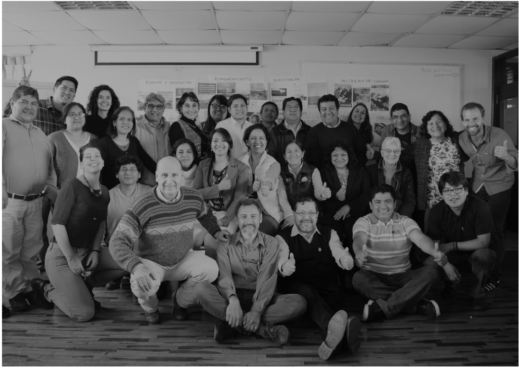
Red Muqui, Asamblea Nacional, octubre 2019

De hecho, Red Muqui afirma que la actividad minera y otras actividades económicas, como por ejemplo la agricultura familiar, no pueden convivir en las mismas áreas y por este motivo, para evitar esta superposición, se recalca la importancia del ordenamiento territorial (OT) y de la zonificación ecológica económica (ZEE) como medidas de organización del territorio.