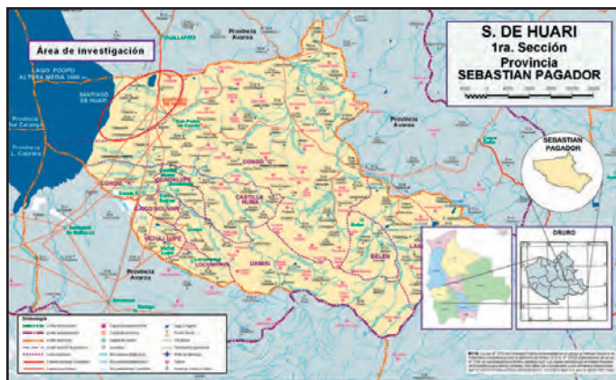
Mapa 1: Ubicación de la zona de estudio

Resultó interesante abordar el tema del cultivo de la Quinua Real desde una problemática que vincula la “acción económica” de los comunarios del intersalar a un contexto