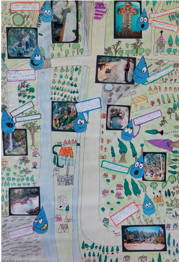
Figura 1: Mapa del pueblo de Ichoca con sus lugares del agua. Elaborado por las y los alumnos de la escuela primaria de Ichoca

y explicaciones tenían una relación con la agricultura. Especialmente la multifuncionalidad de las acequias para la irrigación de las chacras, para la alimentación de los