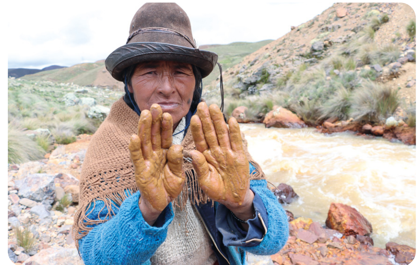
La contaminación la cuenca Jatun Ayllu y Llallimayo, en Puno.

Esta Ley beneficia a empresas y organizaciones informales que buscan apoderarse de los territorios comunales para negocios pri-